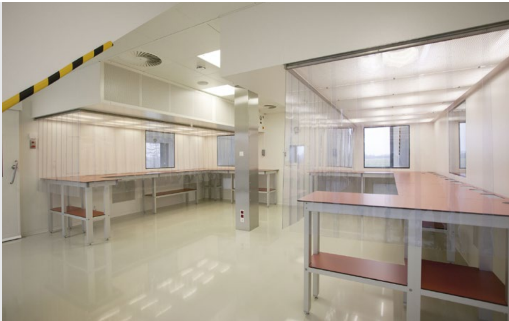
Die Ausstattung des Reinraums aus Profilen der Baureihe X von item.

um Reinigungsmitteln langfristig zu widerstehen. Denn Sauberkeit ist in der Manufaktur sehr wichtig. Umso näher es dem Verpackungsbereich geht, desto strenger werden die Anforderungen an die Hygiene. Die letzte Verpackung findet schließlich im hauseigenen Reinraum statt. Über die Einrichtung des Reinraums berichtet Herr Wollmann: „Die Schleusetüren sind schmal und stehen in einem 90° Winkel zueinander. Es war ein kleiner Kampf, die Tische in den Raum zu bekommen.“ Dem Ergebnis sieht man die Mühen nicht an. Die Tische und Ablagen aus den Profilen der Baureihe X wirken geschlossen und aufgeräumt. Der technisch kleinstmögliche Kantenradius dieser Profile schafft eine annähernd glatte, übergangslose Verbindung zwischen den Profilen. Fugen für Staub gibt es nicht. Die Reinraumprofile haben vollständig ebenmäßige Seitenflächen.