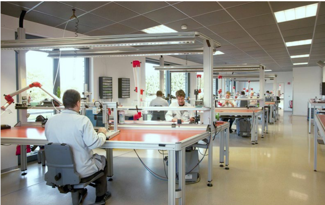
Die Produktionsräume von MTW mit den rautenähnlich geformten Tischen.